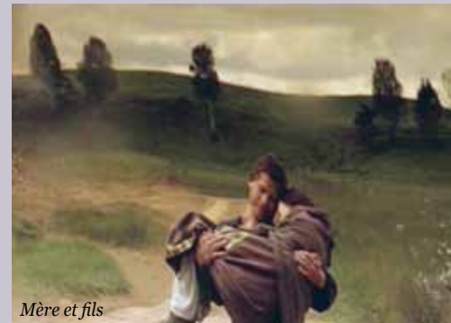
Mère et fils

Au fil du temps, Alexandre Sokourov prend ses distances avec le pouvoir et se déclare hostile à toute intervention armée hors des frontières de la Russie. Sur l'Ukraine, sa position est claire : "Nous ne sommes pas un seul peuple. Nous avons beaucoup de choses en commun mais nous sommes différents." À la suite de quoi, il est censuré – comme à ses débuts en URSS.